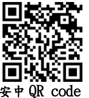
安中 QR code