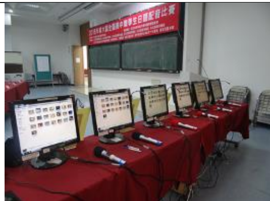
選手競賽站立區二