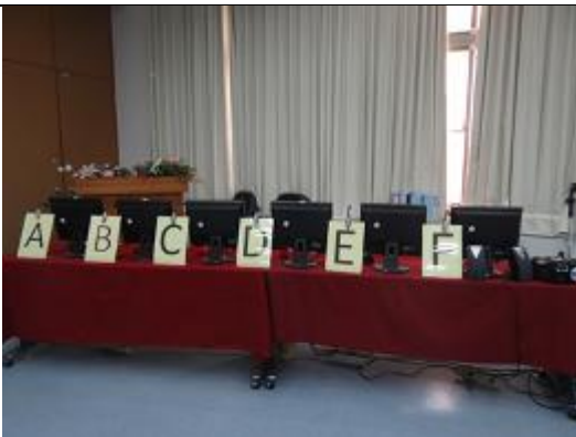
選手競賽站立區一